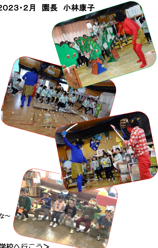
悪い鬼は追い出せたかな～

「泣き虫鬼」「おふざけ鬼」「おこりんぼう鬼」などの鬼が出てきました。年長さんになると自分の生活を振り返ったり、自分のいけない部分もわかっていたりして微笑ましく思い、子どもは子どもなりに一生懸命考えて生きている事に嬉しくなりました。節分の行事を通して「鬼にまつわる絵本を見る」「節分の由来を知る」「鬼のお面をつくる」「自分を振り返る」など様々な豊かな経験をしました。伝統行事大事ですね。お家でも一緒に楽しんでみてください。