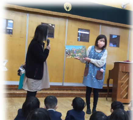
今年の干支ウサギは何番目？

外はすっかり雪景色ですが、子ども達はとても元気に登園してくれました。冬休み「じいじ、ばあばにお年玉もらった！」「スキー行ってきた！」と一生懸命教えてくれた子ども達です。始業式、まずはみんなで「明けましておめでとうございます。今年もよろしくお祈りします。」とご挨拶をしました。それから園長先生のお話では「今年うさぎ年ですが、うさぎは何番目でしょうか？」とクイズがだされ十二支の絵本を読んで頂きました！うさぎは4番目！みんな正解できたかな!?3学期もあと少し楽しく過ごしていこうね