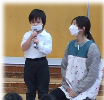
新しいお友達紹介