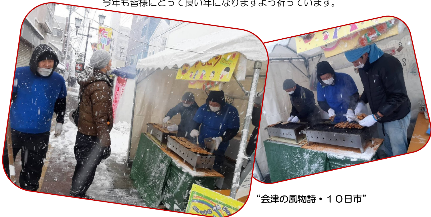
“会津の風物詩・10日市”

今年の干支は卯年です。今年もうさぎさんのように飛んで跳ねて元気に1年を過ごして行きたいと思います。もう早々と跳ね出した会長さんを始め総務さんと親父部さんです。国際化が進む中、日本の伝統文化を感性豊かな子ども達に受け継いでいく事はとても大切な事だと思います。きっと子ども達の心の中に残っていくことでしょう。