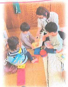
キング組：お友だちと！先生と！それぞれ安心できる場所があります。