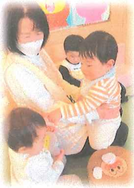
クイーン組：先生と一緒に安心だよ。