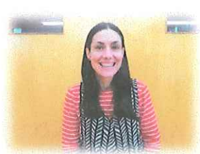
アフリカインストラ