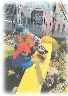
年中組：園庭で活発に遊ぶ姿が多くみられた年中さん！室内では好きなキャラクターになりきって楽しそうに遊ぶ姿もみられました。