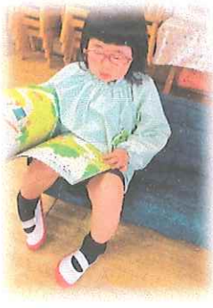
年少組：園内のいろんな場所に興味津々！好きな遊びに巡り合ったり、お友だちが行っている遊びを真似したりする姿がありました。