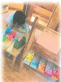
年長組：それぞれに好きな遊びにじっくり取り組む姿や新入園児さんを気にかけて話しかけたり面倒見てあげる姿もありました。