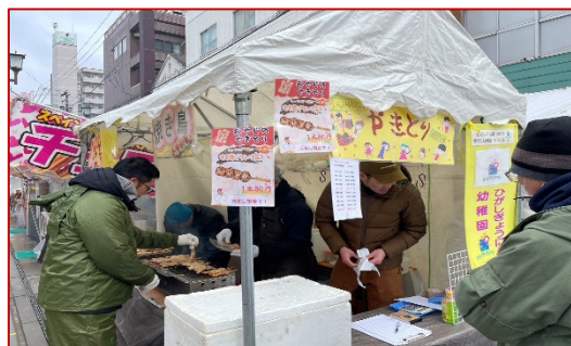
“会津の風物詩・10日市”

さて 幼稚園では今日からいよいよ最後の集大成の始まりです。年長組は、保育日数があと41日、年中少組は45日です。この数を聞くと毎年身が引き締まる思いでいっぱいになります。今伸び時の子どもたちです。最後の指導のポイントは「見る力・聞く力」を育てる事です。集団の中では「見る力」と「聞く力」が弱いと次の行動に結びつかないからです。幼児期は自分の体験したことを中心に理解しますが、小学校以降は、知らないことも聞いてイメージをわかせることが求められます。そのためには「絵本をたくさん読むこと」が必要となります。これからも絵本とのふれあいを大事にして、イメージを膨らませていく体験を積み重ねていきたいです。ご協力を宜しくお願いいたします。