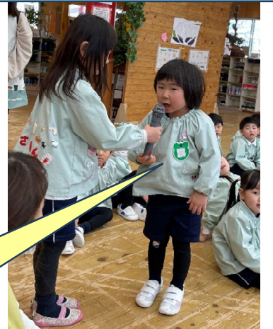
聞いてみたいことはありますか？

【年中さんからの質問】 お泊り会、寝る時がドキドキします！ 【年長さんからのアドバイス】 みんなと一緒に大丈夫だよ！！