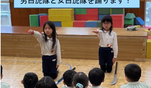
発表会でオペレッタをします！