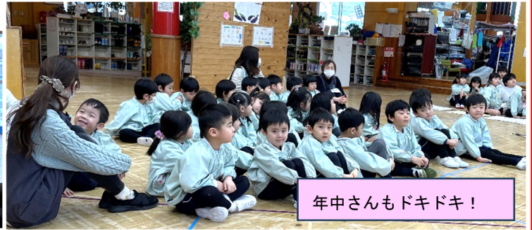
年中さんもドキドキ！