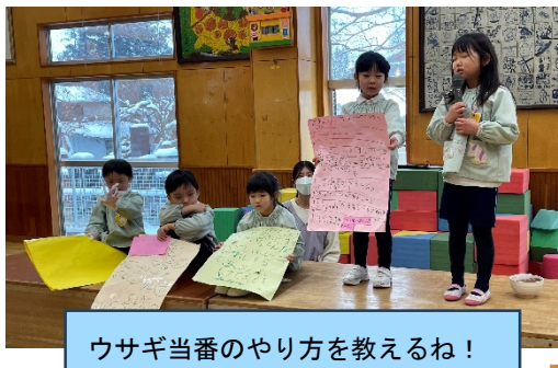
ウサギ当番のやり方を教えるね！