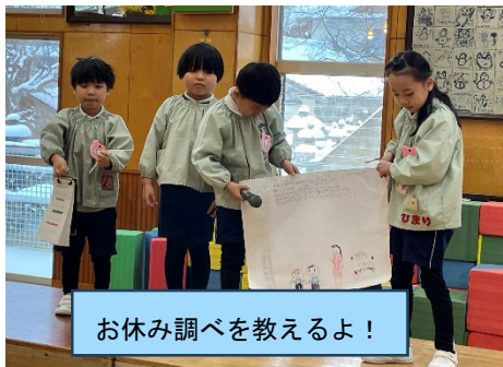
お休み調べを教えるよ！