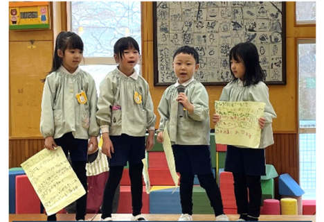
誕生日会も役割分担をしていくよ！