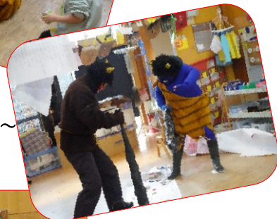
悪い鬼は追い出せたかな～