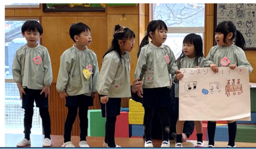
お泊り会、年中さんにメッセージを送ります☆