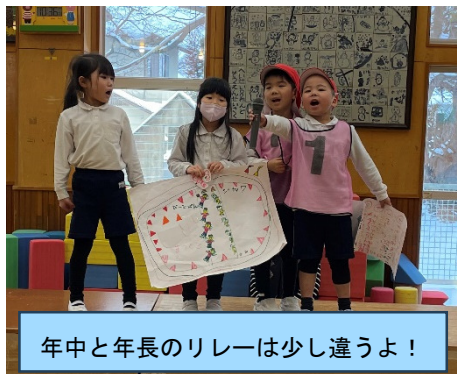
年中と年長のリレーは少し違うよ！