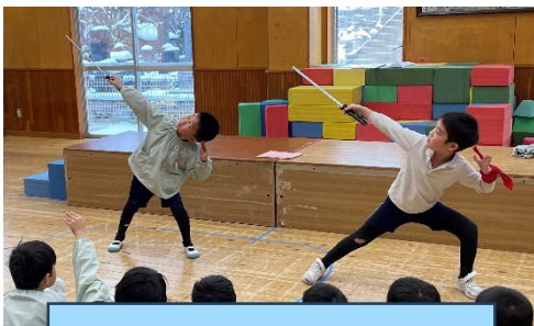
男白虎隊と女白虎隊を踊ります！