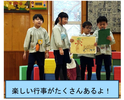
楽しい行事がたくさんあるよ！